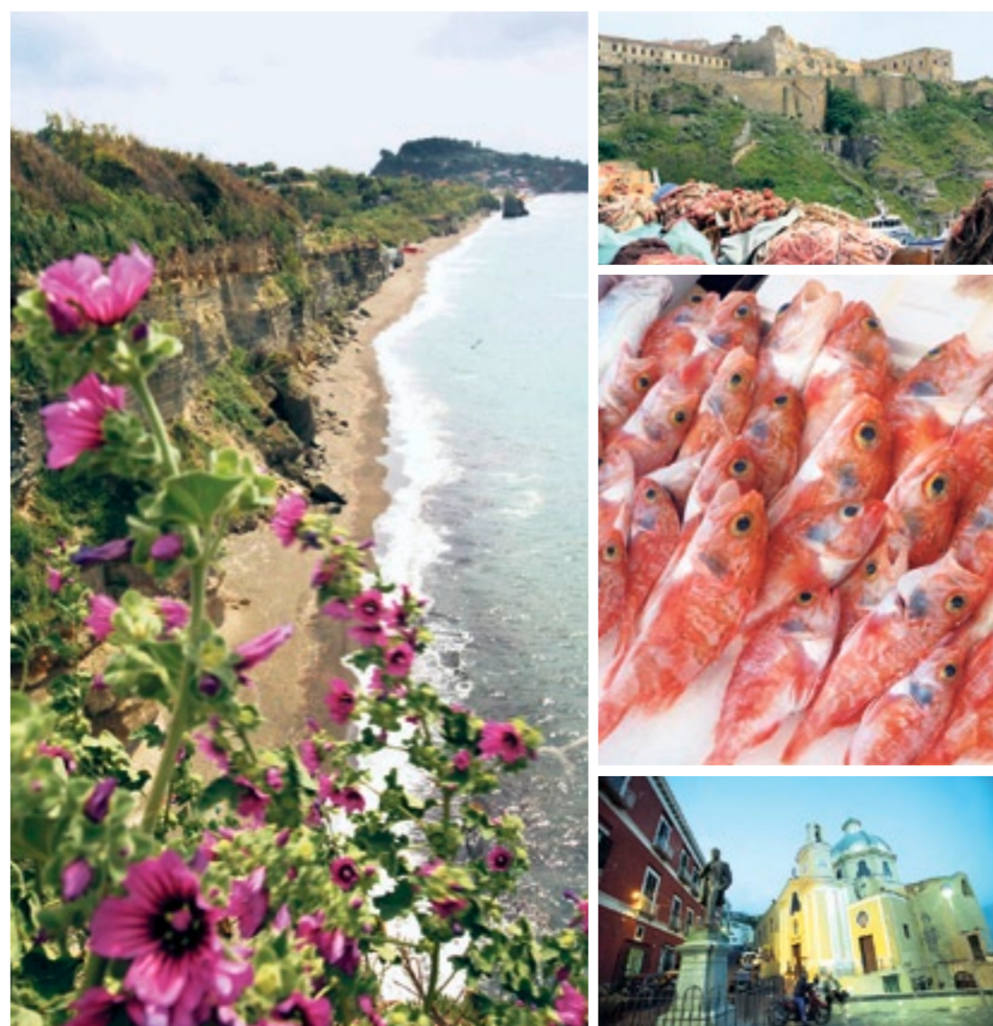
Einladende Küste: Der Strand von Ciraccio. Ehemaliges Gefängnis: Die Burg Terra Murata. Marktangebot: Guter Fang. Strassenszene: Kirchenplatz in Procida