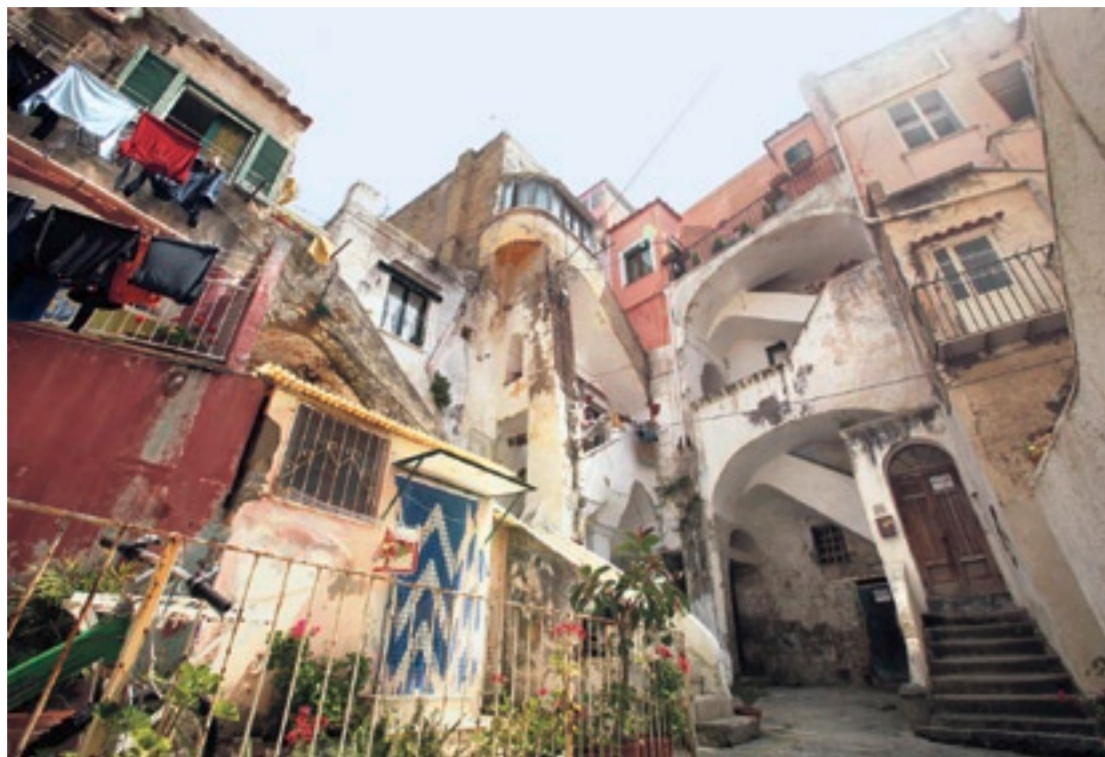
Seeleute brachten Stile aus aller Welt mit: Architettura spontanea

Judith Schallansky: «Atlas der abgelegenen Inseln. Fünfzig Inseln, auf denen ich nie war und niemals sein werde», Mareverlag, 143 Seiten, 52 Franken