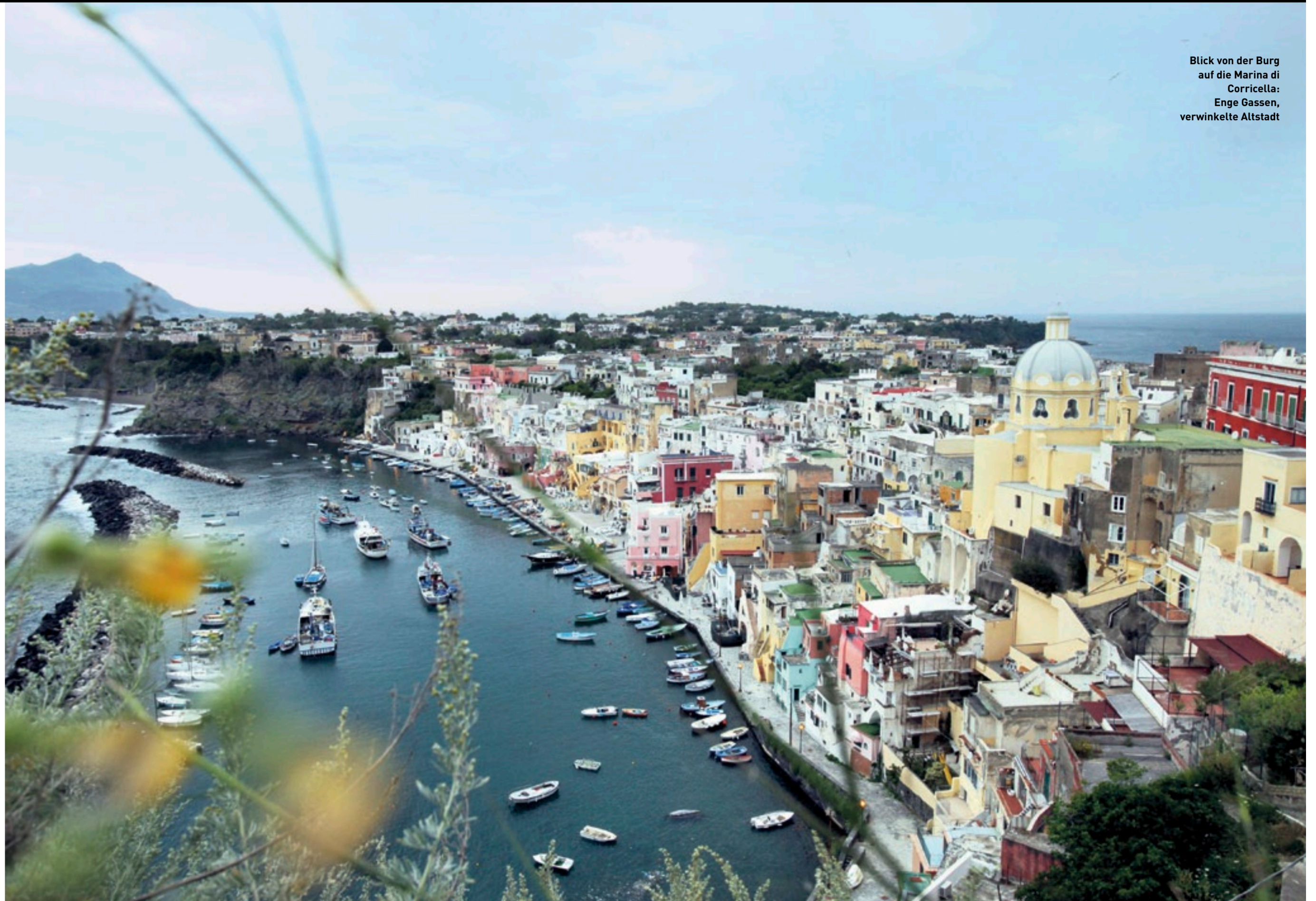
Blick von der Burg auf die Marina di Corricella: Enge Gassen, verwinkelte Altstadt