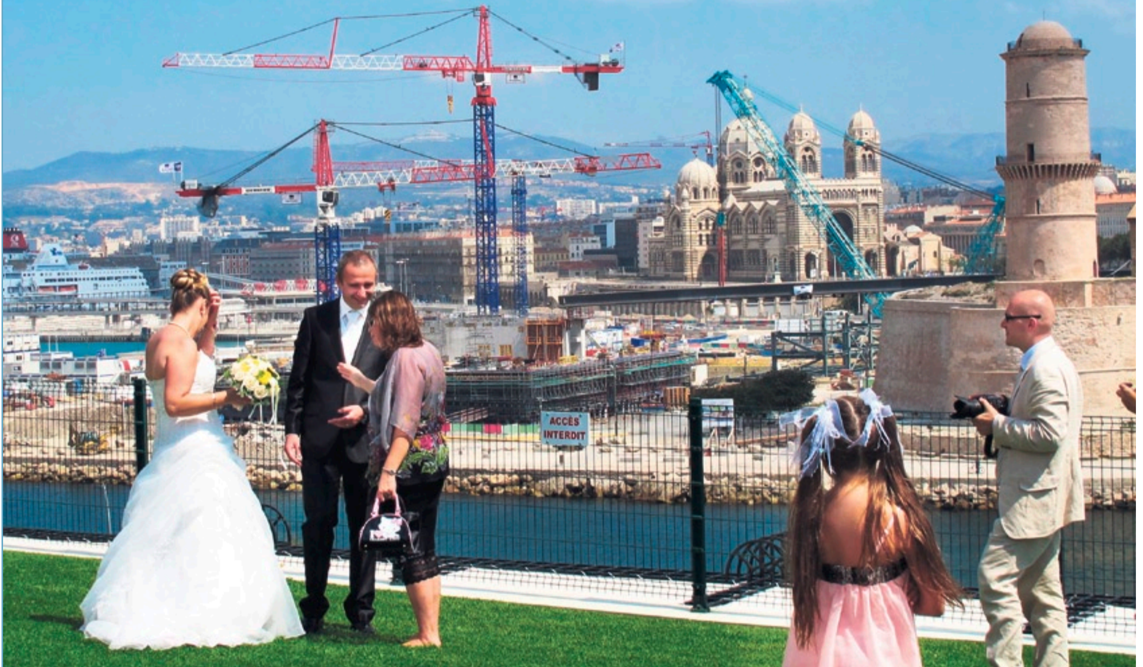
Aufbruch: Hochzeitspaar im Jardin du Pharo, im Hintergrund die Kathedrale Sainte-Marie-Majeure de Marseille und die Baustelle des Megaprojekts Euro Méditerranée

Die südfranzösische Metropole ist im Umbruch – neue Architektur, aufstrebende Viertel, gewagte Gastronomie