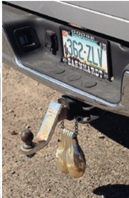
«Hier lernen die Kinder zuerst schiessen, bevor sie laufen können»: Cowgirl Eunice auf der Apache Spirit Ranch, Pick-up mit «Truck Nuts»