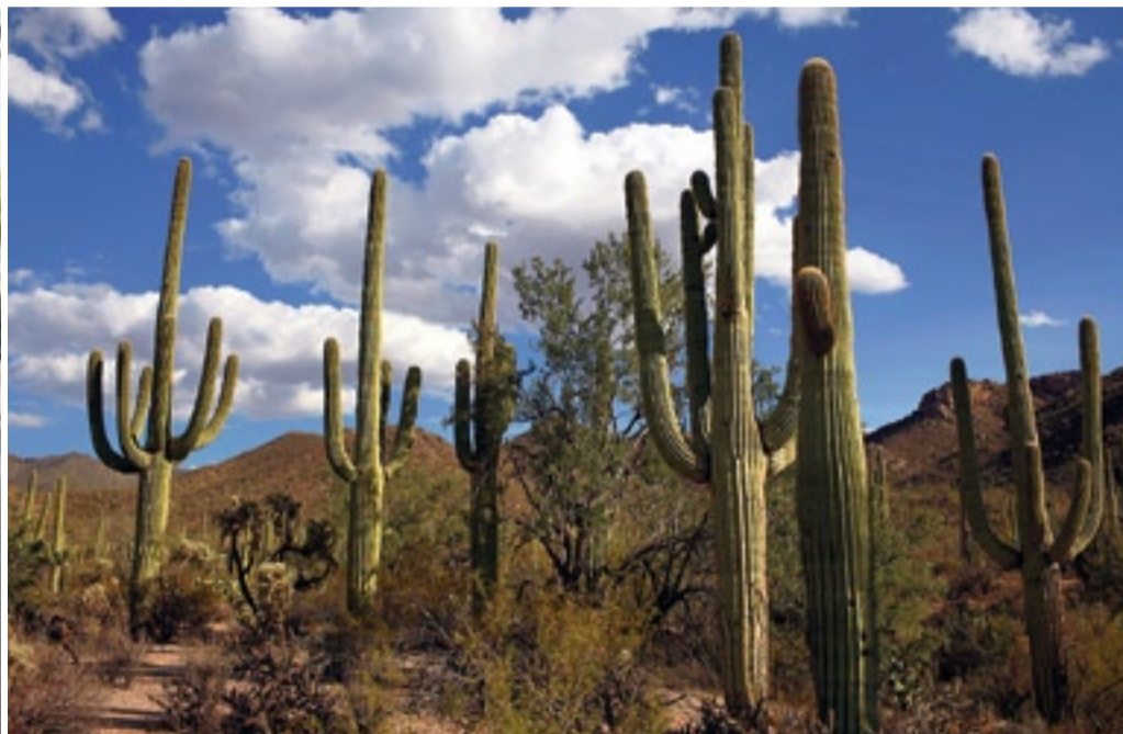
Zwischen Stadt und Wildem Westen: 4 th Avenue in Tucson, Arizona, Saguaro-Kakteen in der Wüste