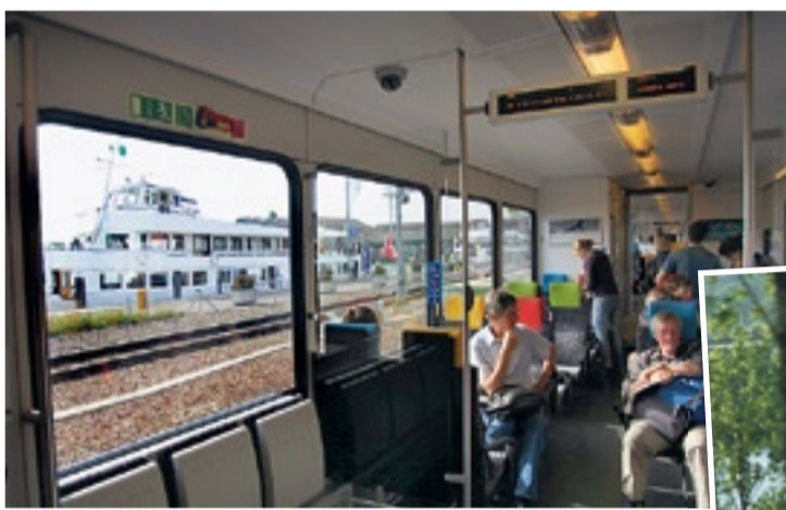
Bahn frei: Essen im Glacier-Express. Nach dem Rheinfall (unten) gehts im «Turbo» zum Bodensee