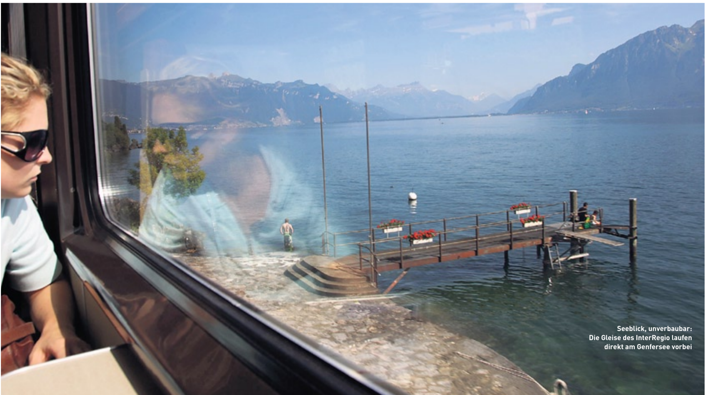
Seeblick, unverbaubar: Die Gleise des InterRegio laufen direkt am Genfersee vorbei

Einsteigen, bitte: Wie man in 16 Stunden Zugfahrt möglichst viel von der Schweiz sieht