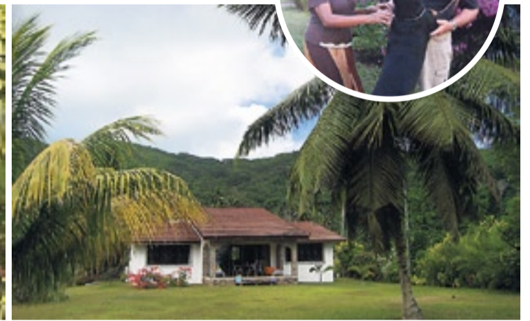
Beliebt bei den Soldaten der US-Navy: Berjaya Beau Vallon Bay Resort (links). Wohnen und kochen: Blue Lagoon Chalets