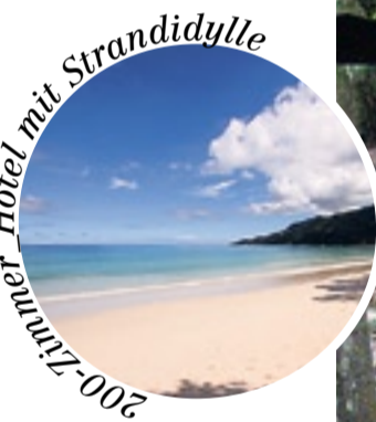
200-Zimmer Hotel mit Strandidylle