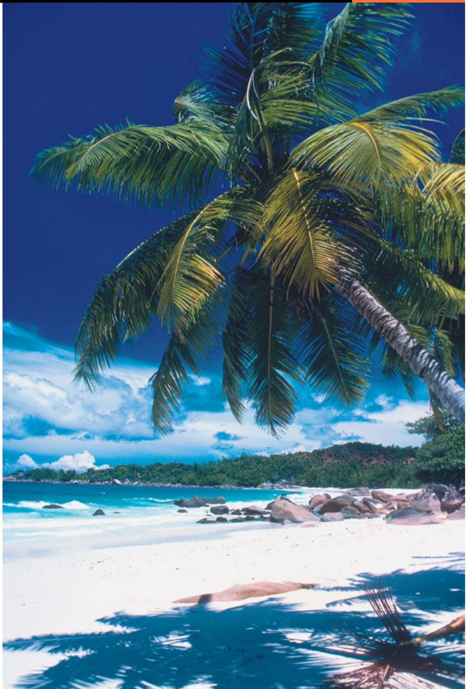
Umwerfend schön und zumindest unter der Woche ruhig: Anse Lazio auf Praslin, Seychellen