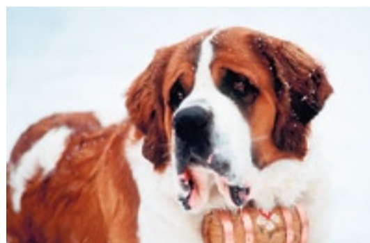
Freut sich über jede Belohnung nach dem Fototermin: Bernhardiner mit Fässli