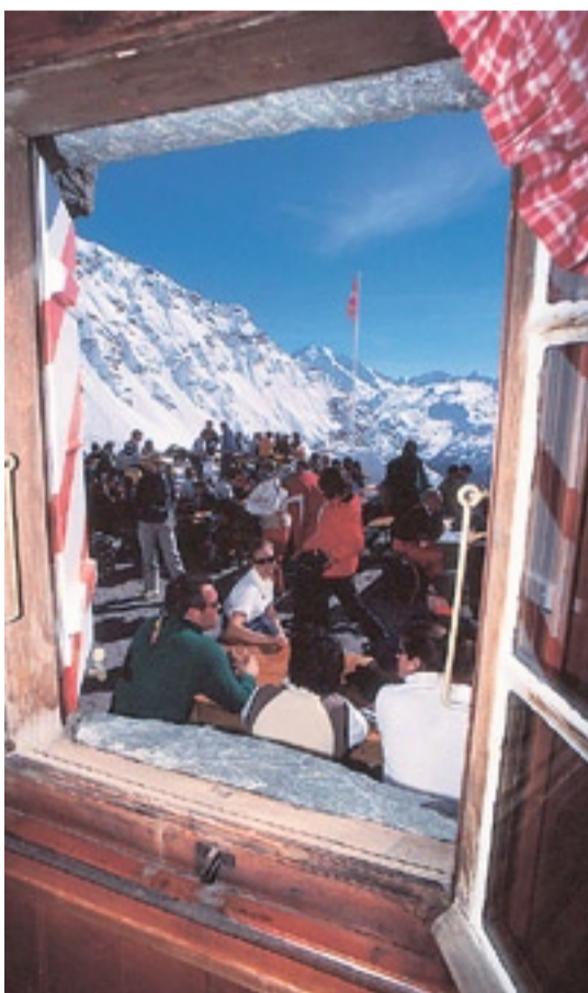
Terrasse mit Blick auf die Walliser Alpen: Skiklub-Hütte unterhalb des Mont Fort