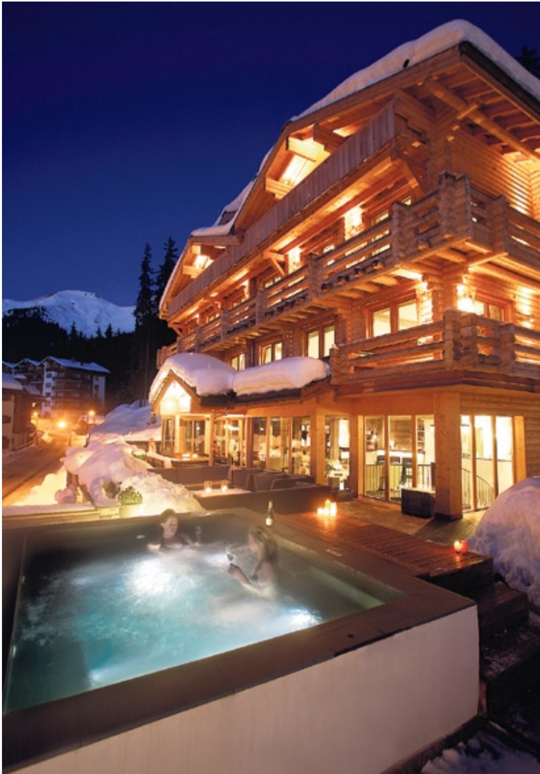
Luxus-Chalet The Lodge von Milliardär Branson: Outdoor-Jacuzzi, Hallenbad, hauseigener Koch

Die Reise wurde unterstützt von Verbier/Bagnes Tourisme