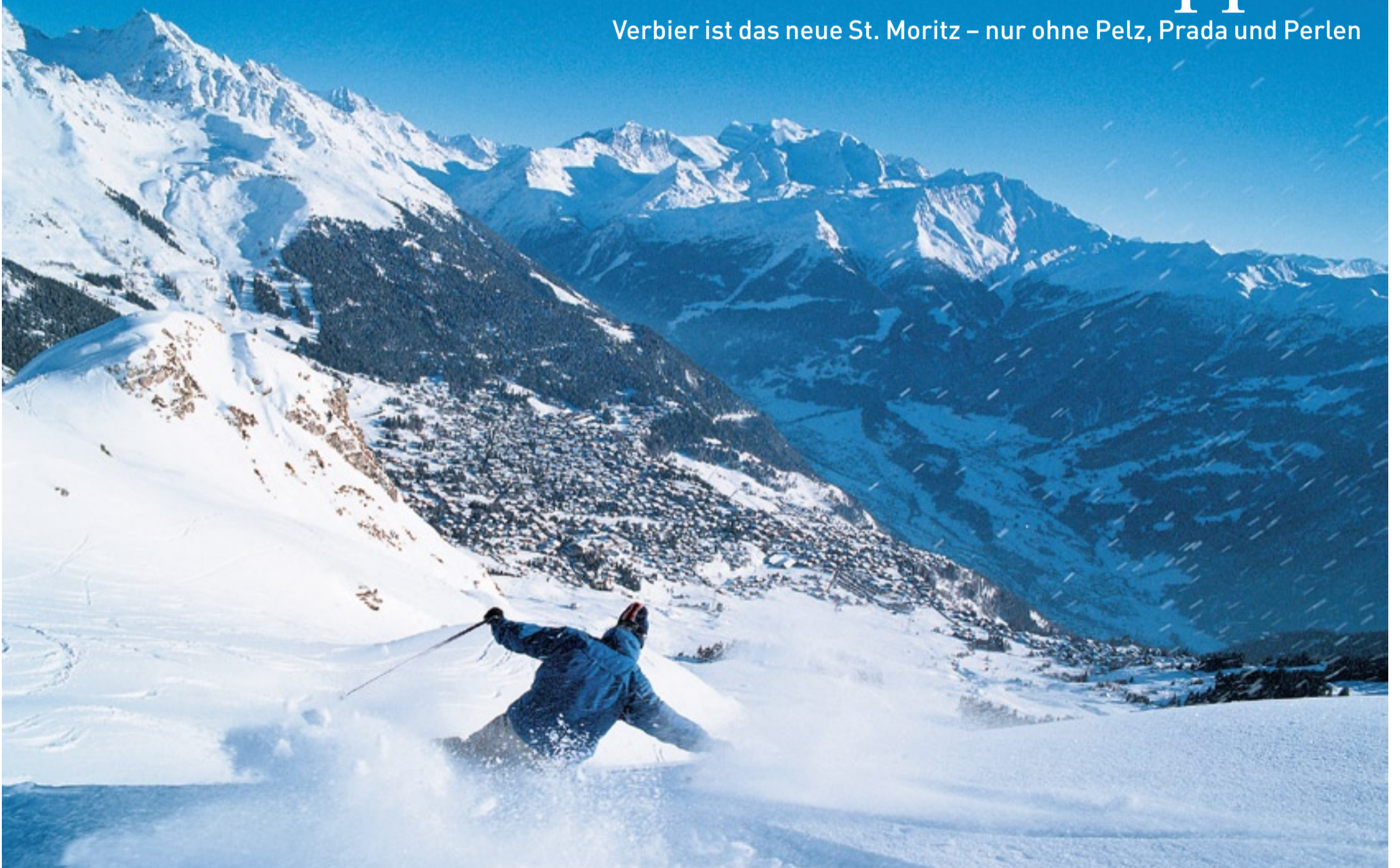
Stiebender Schnee, atemberaubende Aussicht, blauer Himmel: Die Gäste kommen wegen des Sports nach Verbier

Verbier ist das neue St. Moritz – nur ohne Pelz, Prada und Perlen