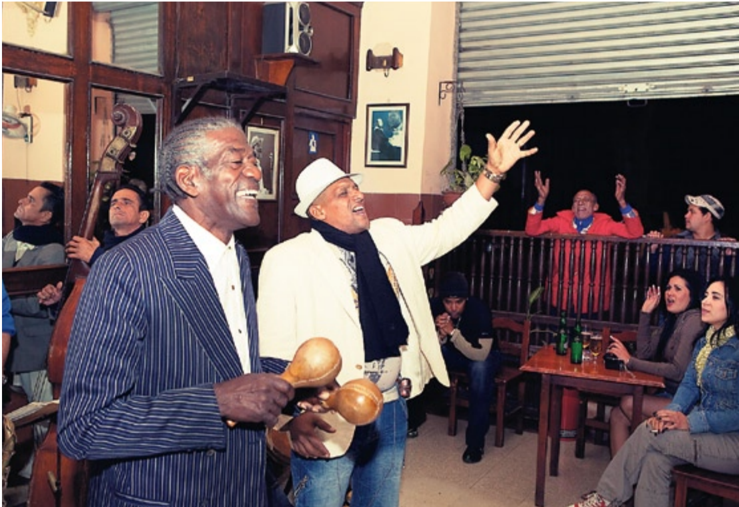
Melancholische Lieder von Buena Vista Social Club: Franklin (M.) singt live in der Monserrate-Bar in Havannas Altstadt

Kuba ist wohl das einzige Land, wo man aus dem Taxi steigt und gefragt wird: «Taxi?» So passiert vor dem Hotel Riviera am Malecón. In Hotel-Klub Copa Room ist die Stimmung wieder eine ganz andere, Clubbing in Havanna bedeutet auch, von einem Viertel, von einer Gesellschaftsschicht in die nächste einzutauchen. Stampfender Reggaeton – ein Mischung aus Dancehall, Reggae, Hip-Hop und Latin – dröhnt aus den Boxen, es ist der Sound der jungen Habaneros. Die Männer mit Gelfrisuren, engen Hemden, zerrissenen Jeans, die Frauen in kurzen,