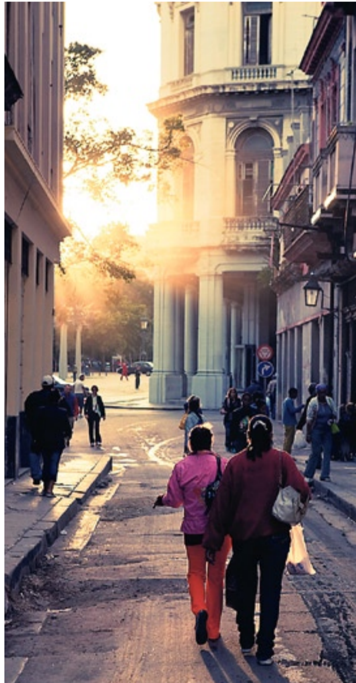
Langsamer Zerfall: Koloniale Gebäude in Habana Vieja

► Salon Rojo, Ecke Calle 21 und N, Vedado. Eintritt ab 15 CUC. Eine Institution im Nachtleben Havannas. ► Don Cangrejo, Ecke Avenida 1 und 16. Strasse, Miramar, Eintritt 5 CUC ► 11 y 4, Ecke Calle 11 und 4, Vedado. Eintritt 3 CUC ► Hershey-Zug: Jeden Sonntag, Fahrt von Guanabo bis Hershey, ab 135 Franken (inkl. Getränke und Essen). Buchen bei Kuoni. Visum: Schweizer Bürger benötigen für Kuba eine Touristenkarte, ca. 42 Franken. Allgemeine Infos: www.cubainfo.de , www.cubaweb.cu