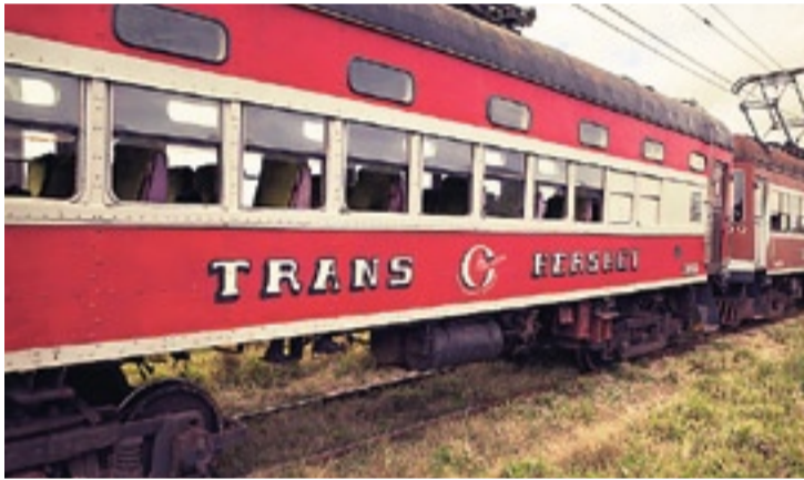
«Guantanamera», «La Bamba»: Cha-Cha-Cha-Kurs im Oldtimer-Zug