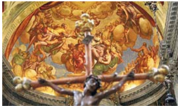
Grandiose Akustik: Kuppel in der Kirche San Pietro di Castello

Der gotische Bau gehört zu einem Kloster, in dem heute noch Mönche wohnen. Der einst geschlossene Konvent prägte die Architektur: Die Mönche durften das Kloster nicht verlassen, hatten aber direkten Zugang zur Kirche, wo sie die Messe durch Gitterfenster verfolgten. Andreas Handygebimmel durchdringt die Stille. «Pronto», nimmt er das Telefon ab. Eine Order von oben?