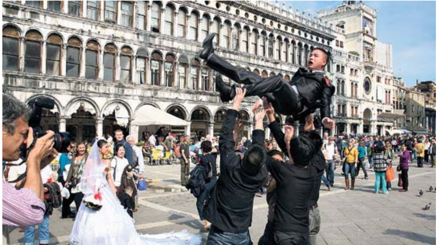
Auf Sightseeing-Tour kurz in Venedig gelandet: Auf dem Markusplatz gibt es das obligate Erinnerungsfoto für das Brautpaar